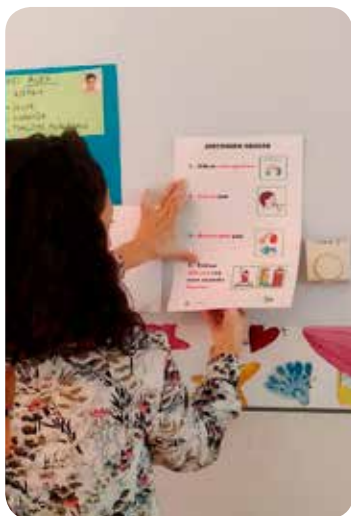
Normas del comedor: explicado con pictogramas y LF