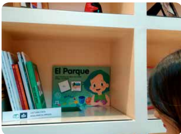
Biblioteca de LF: creado por libros de LF