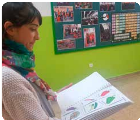
Cuaderno de comidas escritas con el apoyo de pictogramas