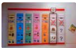
Para estructurar el horario

para las personas que presentan dificultades en la comunicación: