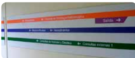
Ejemplo: Señalización de un hospital