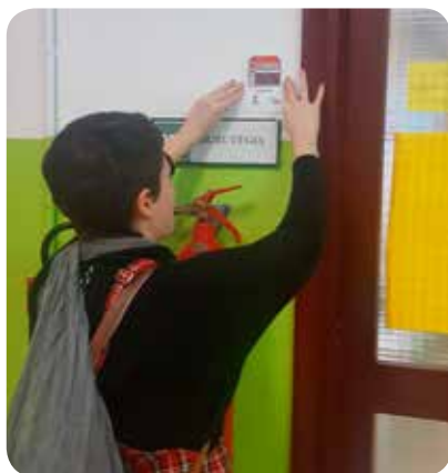
Señalización con pictograma de la biblioteca